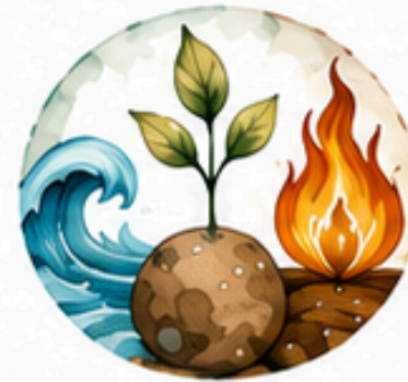
LOS CUATRO ELEMENTOS FUNDAMENTALES DE LA NATURALEZA