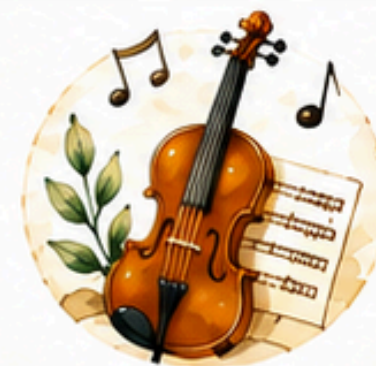
HISTORIA DE LA MÚSICA