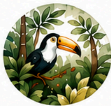
TODO SOBRE LA SELVA